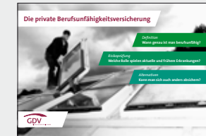
Die private Berufsunfähigkeitsversicherung